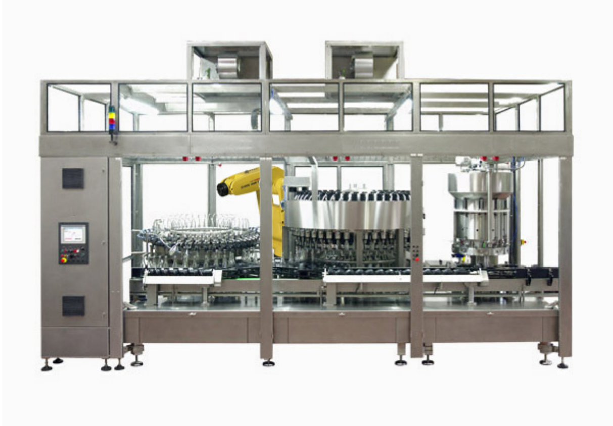
Bild 4 Formatwechsel der Zukunft

Im folgenden Bild sehen Sie die Zukunft des Formatwechsels, exakt reproduzierbar, mittels sechsachsigen Knickarmroboters auf einer linearen Portalachse montiert. Hier entfallen die lästigen Anfahrzeiten und Feinjustierungen.