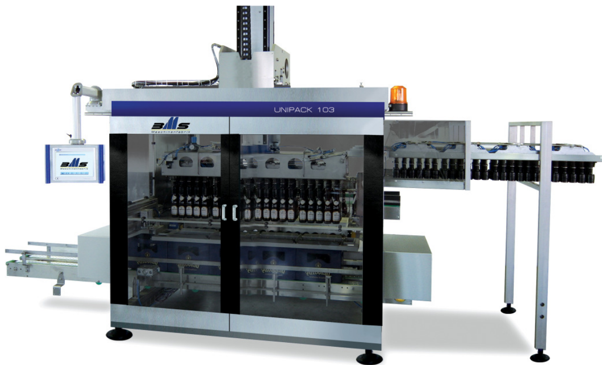
Bild 3 Greiferkopfwechsel an einer Einpackmaschine mittels Magazin

Auf dem folgenden Bild ersehen Sie wie Greiferkopfgarnituren geschickt mit einer Schiene gewechselt werden und gleichzeitig neben der Maschine gelagert werden können. Natürlich ist diese Vorgehensweise für alle anderen Maschinen ähnlich denkbar.